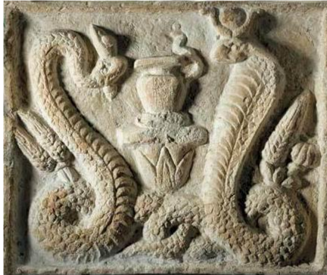
Исида, Осирис и Гор в виде змей