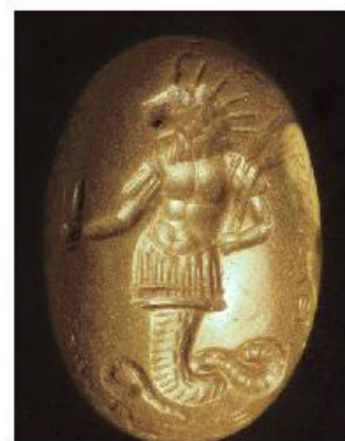
Гностический львиноголовый змей

В иудейской традиции Самаэль это главный правитель пятого неба, один из регентов семи миров, которому подчиняется два миллиона ангелов. В Талмуде говорится о нем, как об ангеле-хранителе Исава и