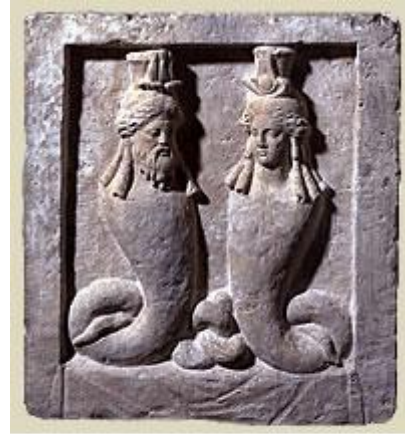
Серапис и Исида