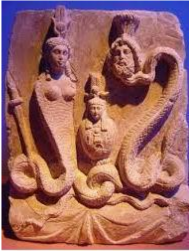
Исида, Серапис и Гор