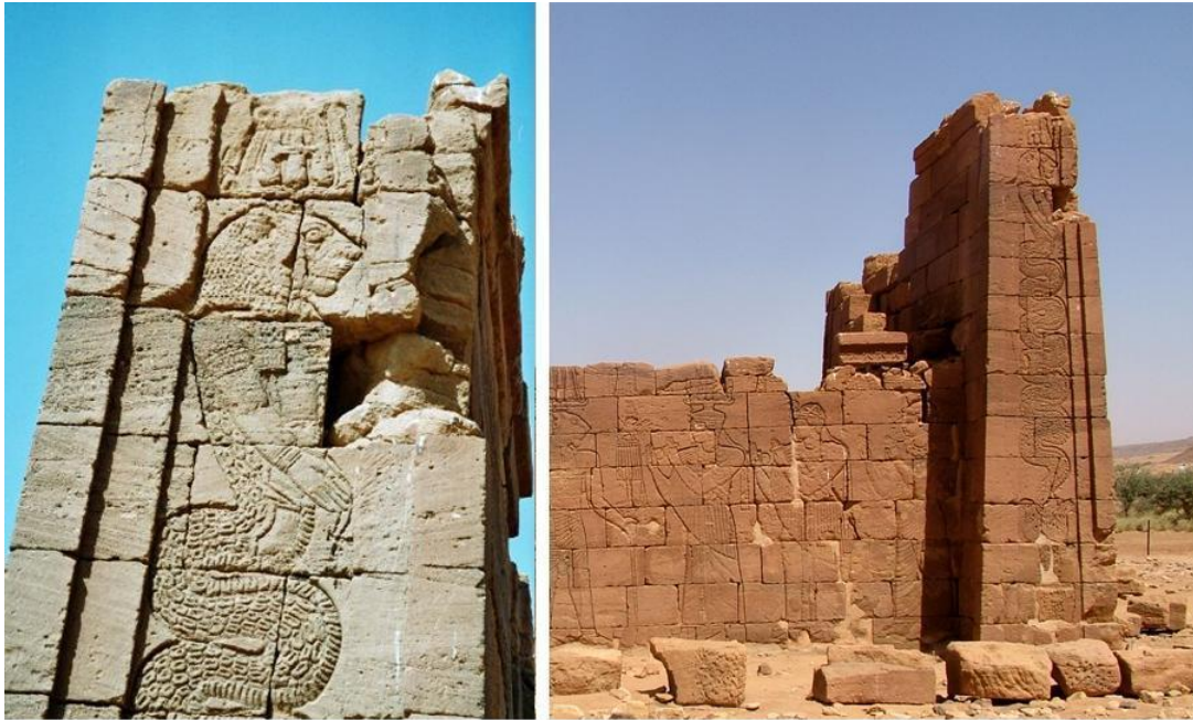
Львиноголовый Змей Апедемак

мероитских рельефах. В египетском искусстве подобная вещь встречается редко. Тем не менее, огромную змею в вертикальной позиции можно увидеть на виньетке к 87-й главе одного из списков «Книги мертвых». Такая же змея представлена на одном из рельефов храма Эдфу. Обе они по стилю сходны с описанным изображением Апедемака.